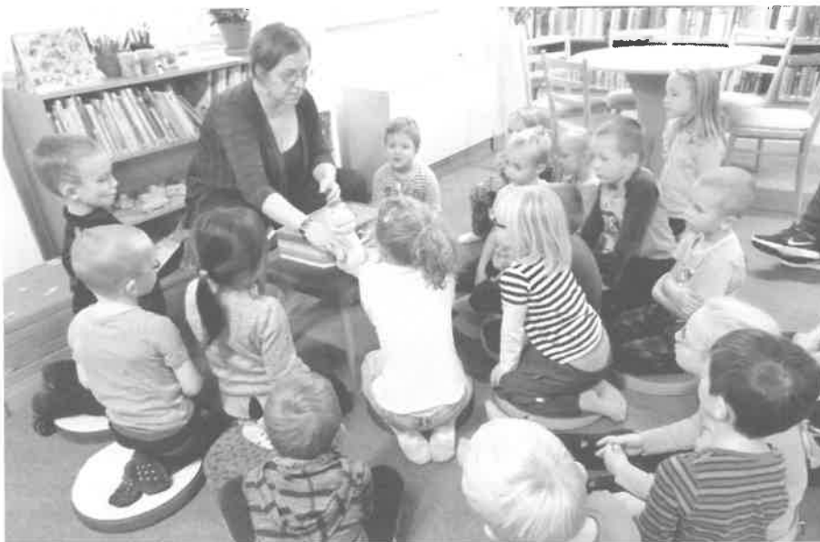
Děti Mateřské školy Sobotka, třída Včeliček v knihovně F. Šrámkova v rámci „Týdne knihoven“.

Tentýž den v 18:00 hod. byla v knihovně vernisáž zahájena výstava ornitologa Pavla Kverka 35 let s králem ptačích pěvců . Při této příležitosti jste mohli také s panem Kverkem o jeho životě se slávky pobesedovat. Pan Kverek dokáže svým vyprávěním zcela nadchnout, slávky žije a má dar své nadšení předávat dál. Slávici v něm mají velkého ochránce. Výsta-