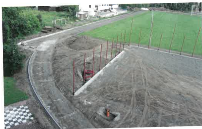
Rekonstrukce areálu – červenec