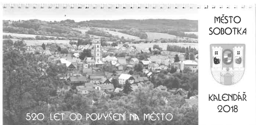
Soboteký kalendář 2018.