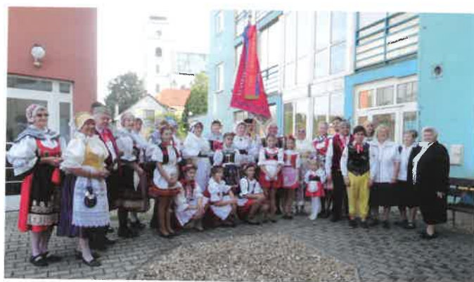
Slavnost svěcení baráčnického praporu, sousedé a tetičky v boleslavských a kyjovských krojích