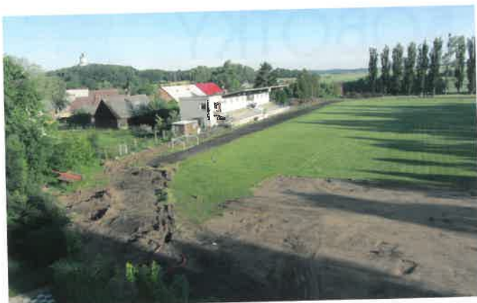
Rekonstrukce areálu – červen