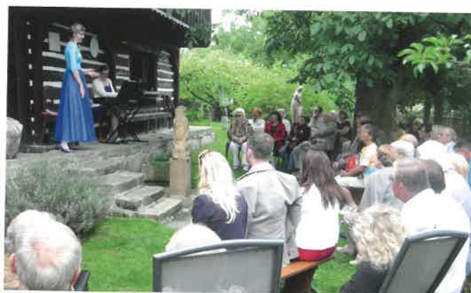
Šolcův statek – koncert sopranistky K. Žmolíkové s klavírním doprovodem L. Juránkové – foto: J. Samšiňák