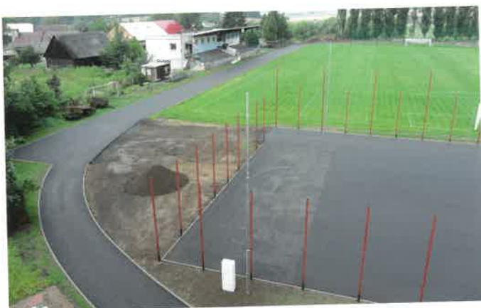
Rekonstrukce areálu srpen