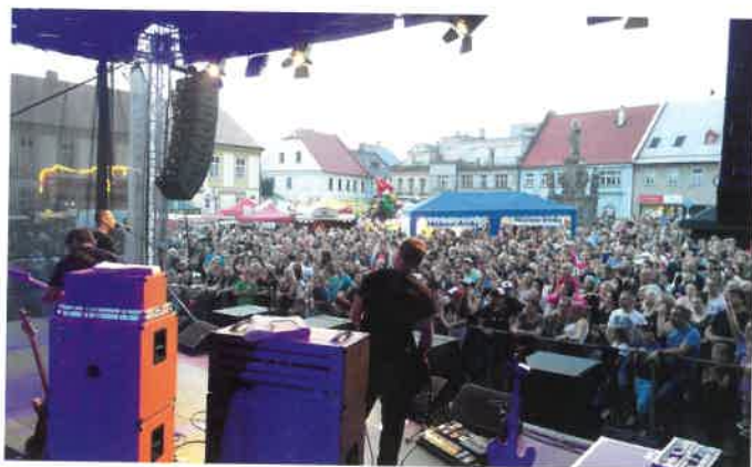
Sobotecký jarmark – kapela Wohnout