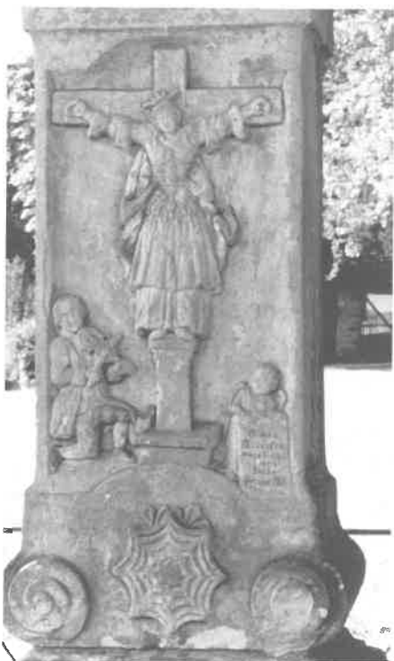
Reliéf svaté Starosty na sousoší Nejsvětější Trojice ve Vesci u Sobotky v Českém ráji.