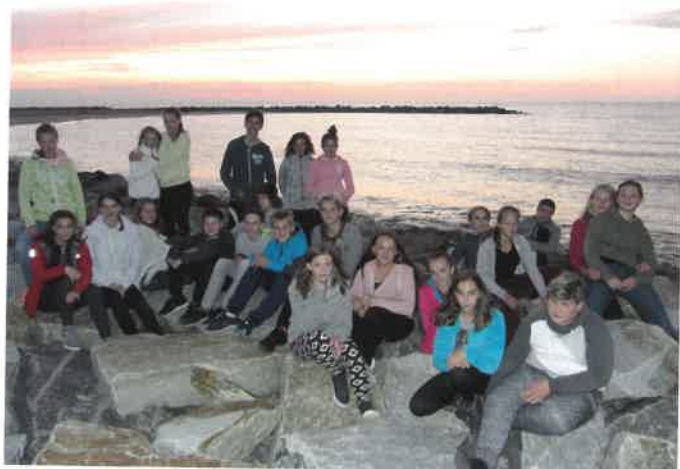
Žáci ZŠ Sobotka v letovisku Jaroslaviec u Baltského moře