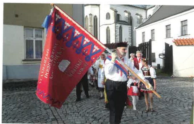
Slavnost svěcení baráčnického praporu – foto: R. Vokounová