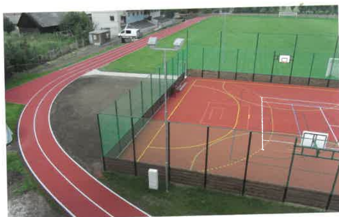
Rekonstrukce areálu září