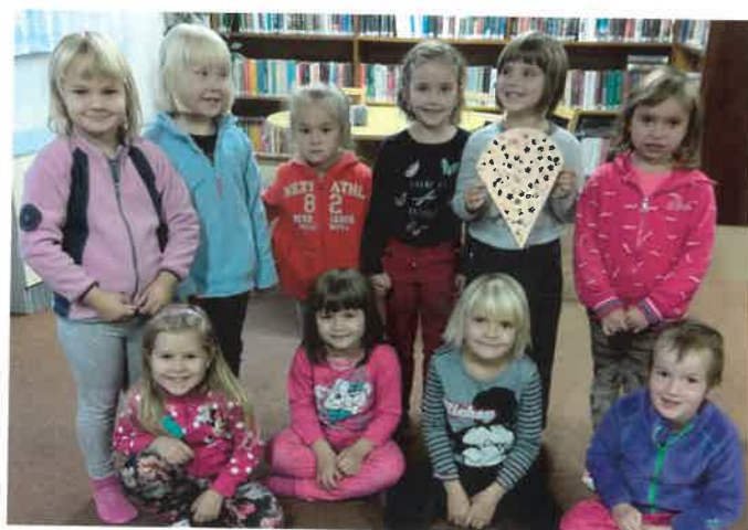
Děti ze třídy Sluníček v Městské knihovně – foto: S. Jandíková